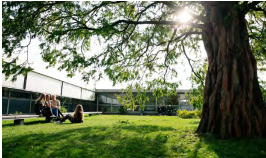
På en skøn solskinsdag som denne kan du nyde skolens grønne områder.

Oplev programmering, klatring, breakdance og meget mere – ÅSG er fyldt med muligheder.