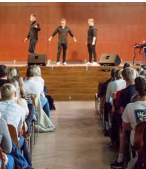
Månedsmøde med specialklassen (Impro Comedy)

Den tilgang til gymnasieliv og undervisning har gennem årene skabt vores egen lille Stats-hemmelighed. Den helt særlige følelse og det helt unikke fællesskab, der gør det lidt sjovere og ikke så lidt anderledes at gå på Århus Statsgymnasium.