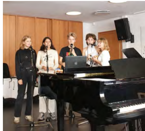
Der øves i musiklokalerne inden optræden i Festsalen.