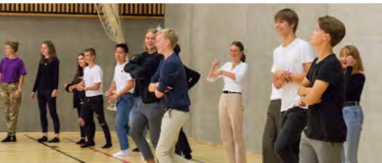
Introaktiviteter i forbindelse med grundforløbet i skolens idrætshal.

Og når du små tre år senere træder ud gennem de samme døre med studenterhuen på hovedet, klar til at indtage hele universet (og de kommende dages studenterfester), vil du stoppe op, lade tankerne glide tilbage til den dér første solskinsdag i august og undres over, hvor de tre år blev af. Og over hvordan rejsen fra start til student har forandret dig på alle tænkelige måder. Hvordan den har gjort dig klar til det næste kapitel i din uddannelse – og i dit liv.