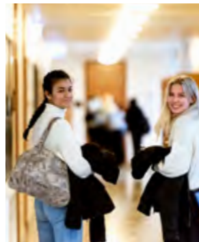
Det emmer af liv på skolens fællesområder, hvor der er plads til både gruppearbejde og frikvarter.