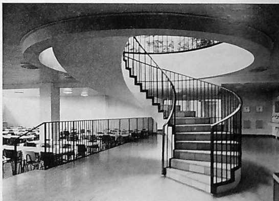
Nedgang til frokoststuen