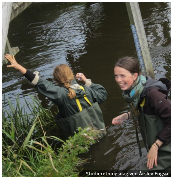
Studieretningsdag ved Årslev Engso