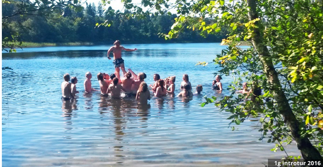
1g introetur 2016