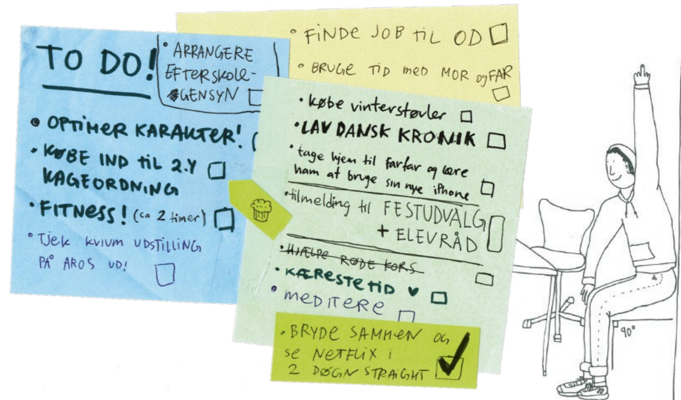
Illustration: Anne Kirsten Beck