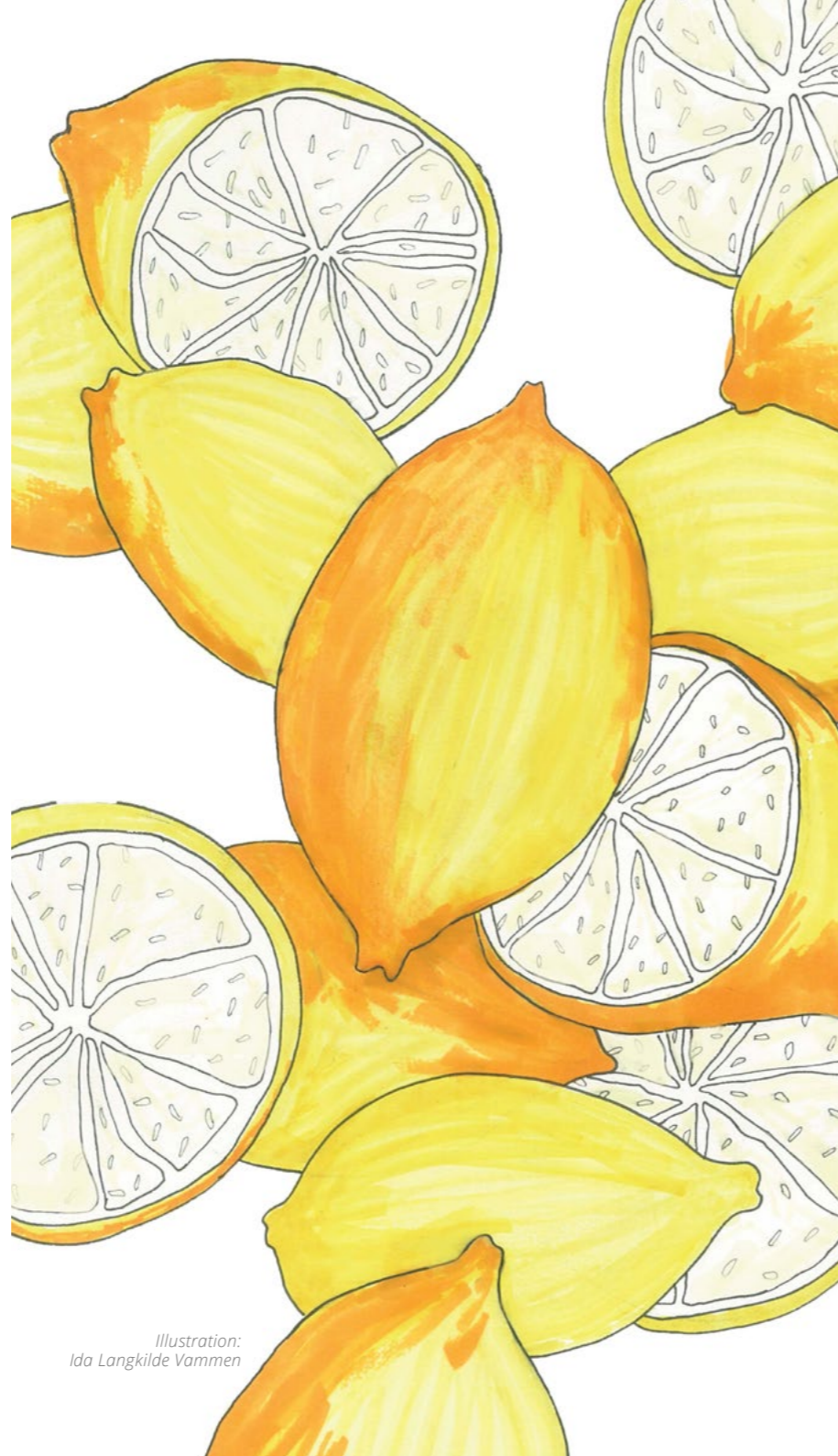
Illustration: Ida Langkilde Vammen