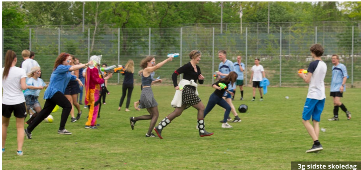
3g sidste skoledag