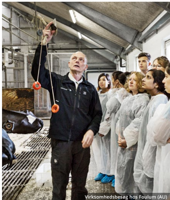
Virksomhedsbesøg hos Foulum (AU)

Som noget særligt er der for hver klasse løbende gennem de tre år desuden særlige studieretningsdage, hvor studieretningsfagene arbejder sammen i et forløb koncentreret på én dag, med et samarbejde gennem et udvalgt tværfagligt emne og ofte med en ekskursion ud af huset.